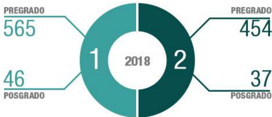
Gráfico No. 1 ESTUDIANTES MATRICULADOS EN PRIMER SEMESTRE AÑO 2018