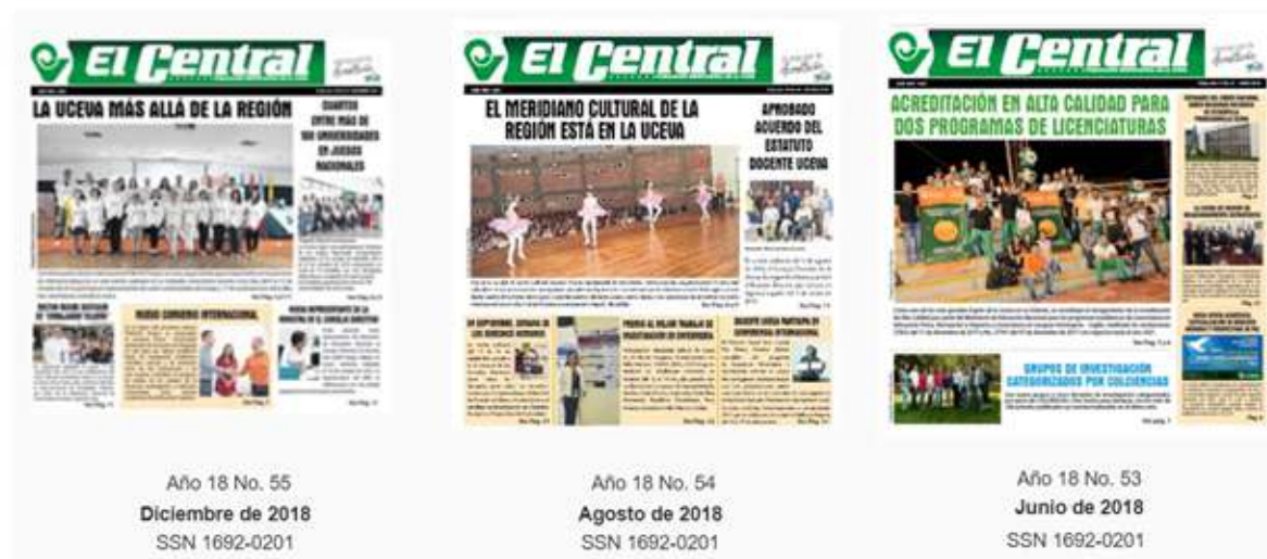
Gráfico No. 7 Ediciones del Central, año 2018