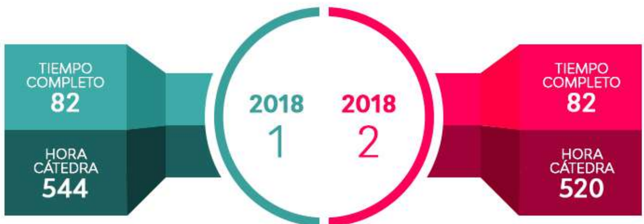
Gráfico No. 5 PLANTA DOCENTE, AÑO 2018

Asimismo, se realizó la gestión para la aprobación ante el Consejo Directivo de la ampliación en planta a treinta (30) plazas para docentes tiempo completo en la modalidad ocasional; con el objetivo de atender las necesidades identificadas en cada programa académico, estas plazas serán cubiertas a partir del primer semestre del año 2019.