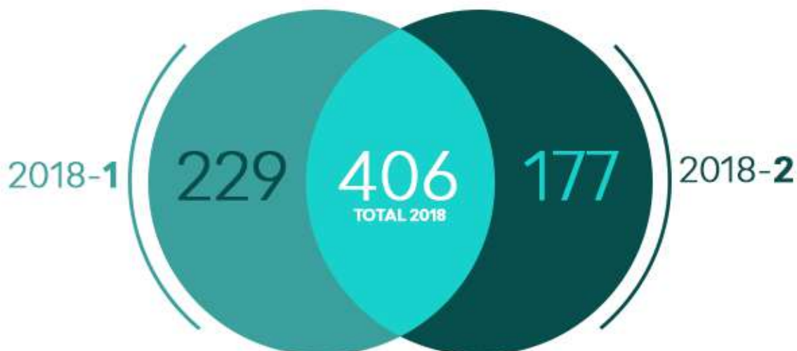
Gráfico No. 2 ESTUDIANTES MATRICULADOS EN EL DEPARTAMENTO DE IDIOMAS EN PRIMER NIVEL AÑO 2018