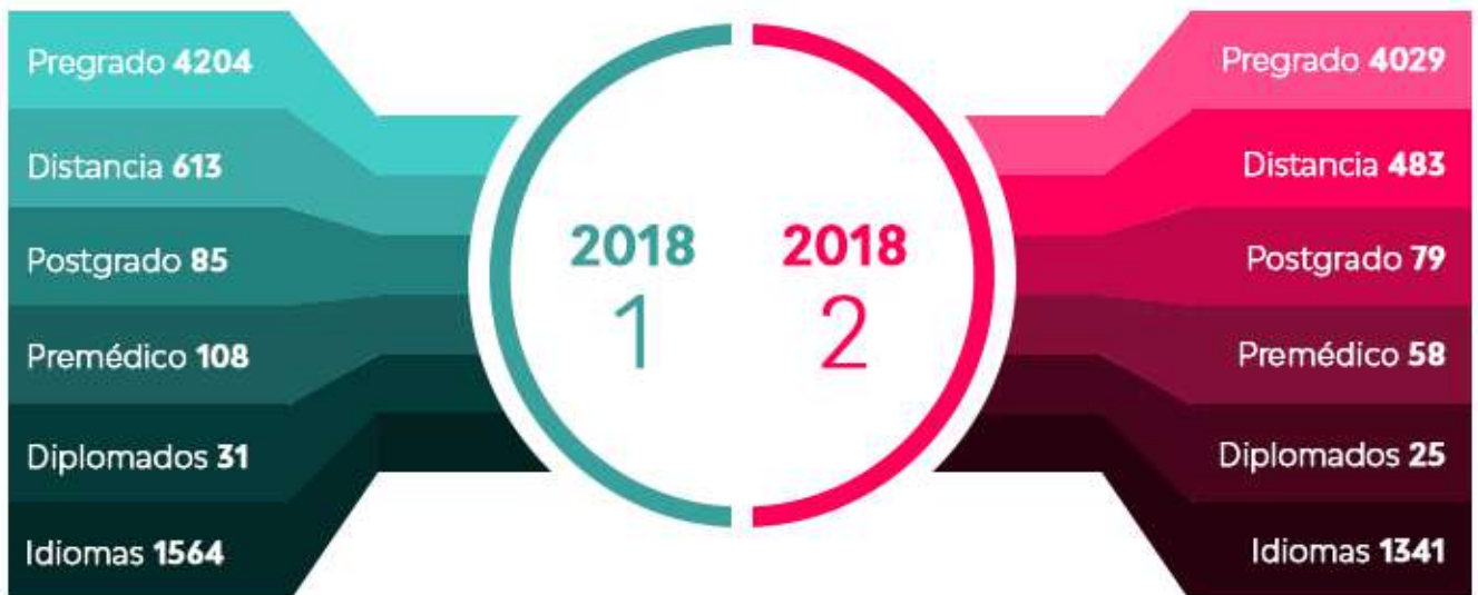
Gráfico No. 4 ESTUDIANTES MATRICULADOS AÑO 2018