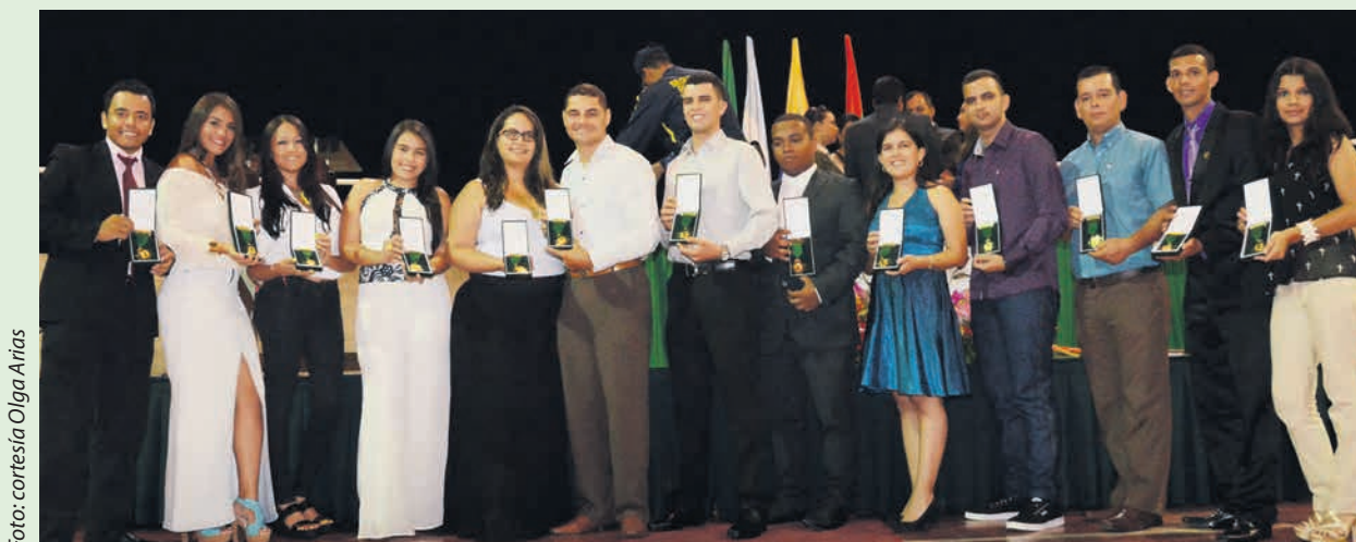
Mejores promedios por Programa de la Institución