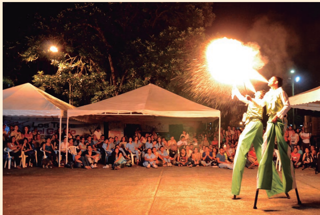
En la apertura de la Semana BINGES, participó el Cuarteto Vocal Uceva y se realizó el concurso sobre conocimiento general – UCEVASABE. Para lograr la cobertura a todos los estudiantes, las actividades se realizaron tanto en la jornada diurna como en la nocturna, culminándose con éxito en ambas jornadas.

Las actividades programadas en este evento de integración, arte, cultura, recreación y deportes se efectuaron en la semana del 23 al 26 de Septiembre del año en curso, teniendo como espacios para el desarrollo de la programación, el Centro Cultural, Gustavo Álvarez Gardeazábal, la Cafetería Central, el Coliseo Carlos María Lozano y la Piscina del Centro de Ciencias del Deporte y la Actividad Física. Se contó con la participación de estudiantes, docentes y funcionarios que disfrutaron activamente de todas las actividades programadas.