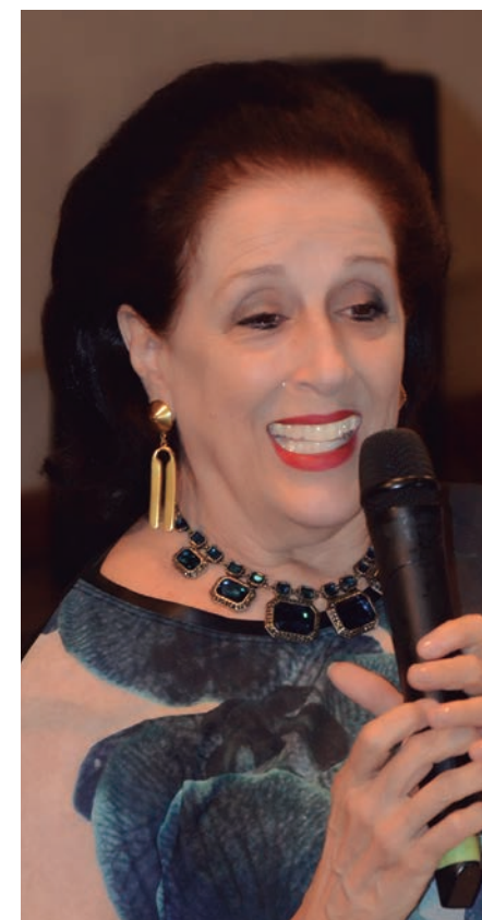
Poeta Agueda Pizarro