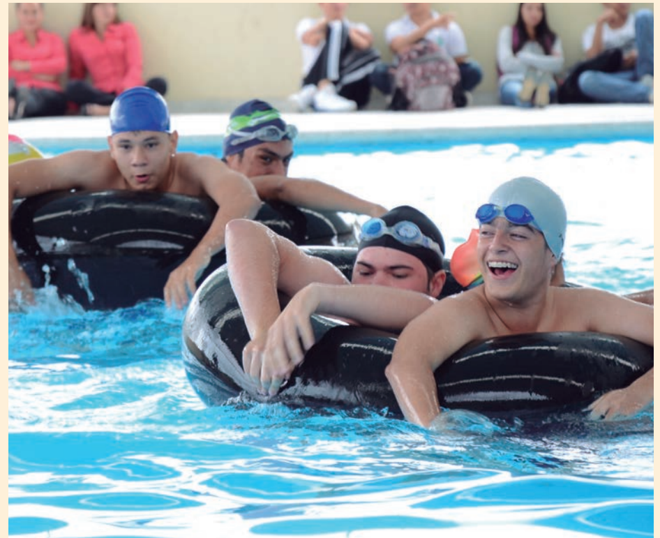
La piscina del Centro de Ciencias del Deporte y la Actividad Física, sirvió de escenario para el II Desafío Recreacuaticos con gran participación de estudiantes.