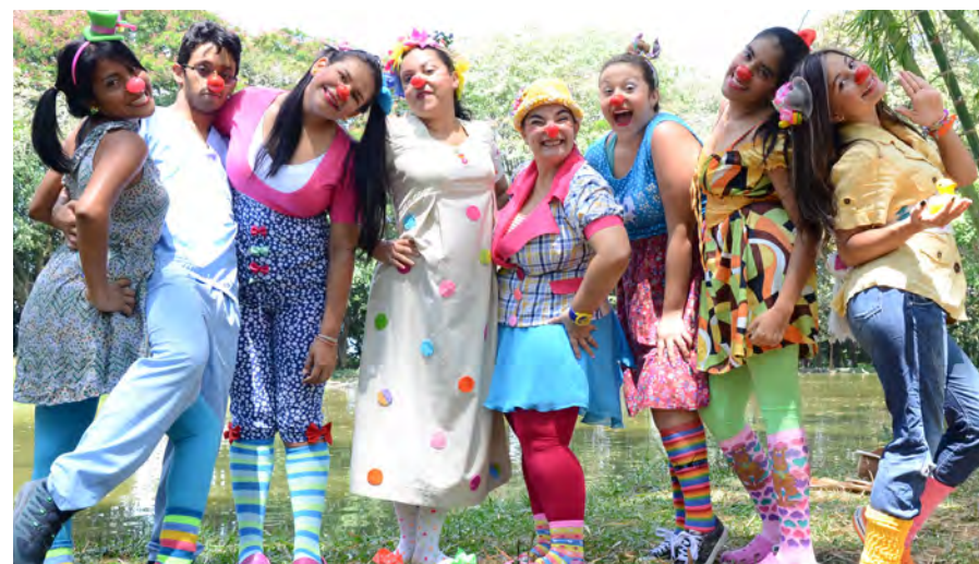
Semillero Corazones Risotones (Ciencias de la Salud)

El número de semilleros de investigación en la Uceva, ha venido aumentando significativamente en los últimos años, se motivan desde las Facultades con el acompañamiento de los Docentes que se convierten en responsables de sacar adelante los proyectos propuestos y con ellos la participación en los encuentros tanto departamentales como nacionales.