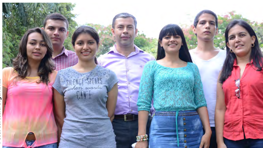
Semillero en Derechos Humanos – (Ciencias Jurídicas y Humanísticas)

Con el direccionamiento desde la Vicerrectoría de Investigaciones y Proyección a la Comunidad, se ha podido articular los semilleros de la Uceva desde de las Facultades y con ellos emprender acciones como la participación en los encuentros departamentales y nacionales, motivados aún mucho más por los importantes resultados conseguidos, gracias al esfuerzo, dedicación y pasión que le imprimen a cada actuación. Para destacar estas participaciones,