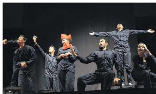
Universidad Pedagógica Nacional de Bogotá

Agradecimientos a las instituciones participantes, que con el gran nivel teatral que demostraron llevándose los elogios y el cariño de propios y extraños que colmaron el máximo centro cultural de la Uceva.