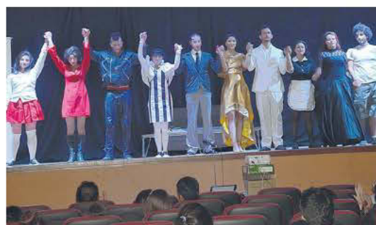
Universidad Industrial de Santander