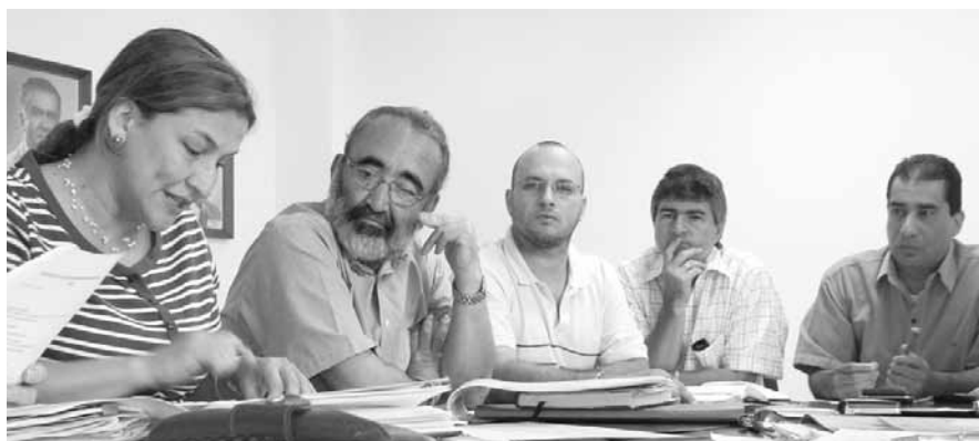
La Vicerrectoría Académica ha venido liderando este proyecto donde se busca el aprendizaje permanente de los docentes de la UCEVA

La EFD está concebida como un espacio que posibilita la construcción de una comunidad de aprendizaje, donde se desarrolle el trabajo autónomo; escenario donde no caben las imposiciones, ni los programas de asistencia obligatoria, ni lineamientos, ni criterios que no sean construidos y negociados colectivamente. Su organización libre, generará nuevas estructuras escolares, nuevos hábitos y también nuevas demandas a la academia, o nuevas opciones que hagan prescindir de ella, porque se trata de una nueva sociedad pedagógica que construye sus propias opciones, sus propios programas de formación, y valida sus propios métodos, en la medida en que asume el