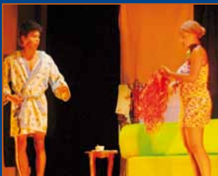
Grupo Escaramusa - UCEVA