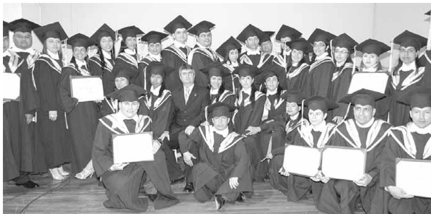
Primera cohorte de egresados de los programas de Tecnología en Regencia de Farmacia, Gestión de Salud, Electricidad, Obras Civiles y Licenciados en Educación Básica con Énfasis en Matemáticas, Humanidades y lengua Castellana.

El 11 de mayo de 2007 se firmó el convenio inter-administrativo No 017 que abrió las posibilidades a los aspirantes y el 31 de julio de 2007 iniciamos con la primera cohorte de Tecnólogos en Regencia de