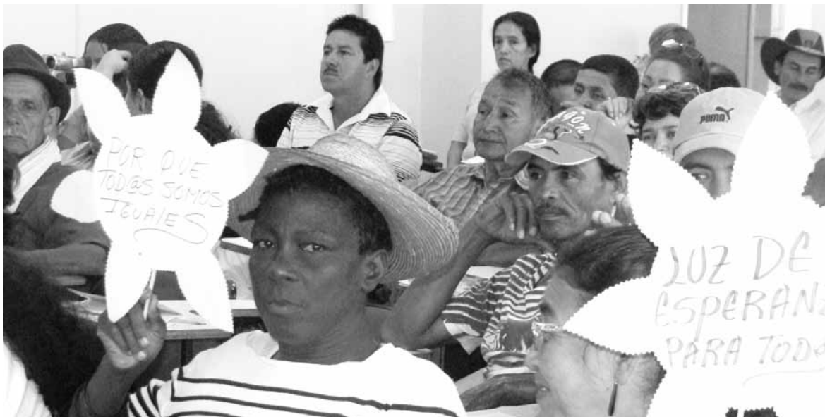
El viernes 10 de septiembre del año en curso se cumplió en el auditorio de Derecho, el primer foro regional sobre el estado actual de la atención a las víctimas del conflicto armado en el Valle del Cauca, organizado por la UCEVA, Corporación Nuevo Arco Iris, Pastoral Social de la Diócesis de Buga, Instituto Julián Mendoza y el Servicio Jesuita a Refugiados.