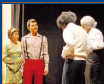
Grupo La Escafandra - Univ. Tecnológica de Pereira

La ciudad respondió a la convocatoria hecha por la UCEVA a través del Centro Cultural Gustavo Álvarez Gardeazábal, asistiendo masivamente a las presentaciones programadas en el "I Festival Universitario de Teatro, Lino Mora", realizado entre el 9 y el 11 de septiembre del año en curso.