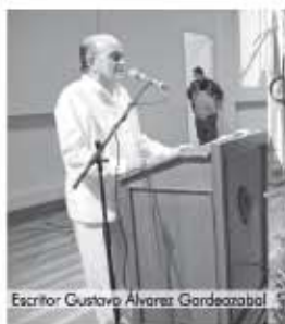
Escritor Gustavo Álvarez Gardeazábal