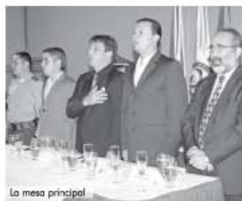
La mesa principal