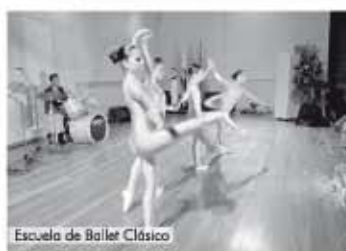
Escuela de Ballet Clásico