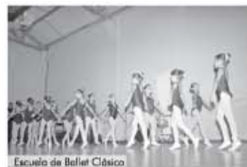
Escuela de Ballet Clásico