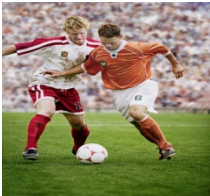
FUTBOL FUTBOL SALA