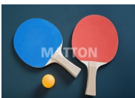
TENIS DE MESA